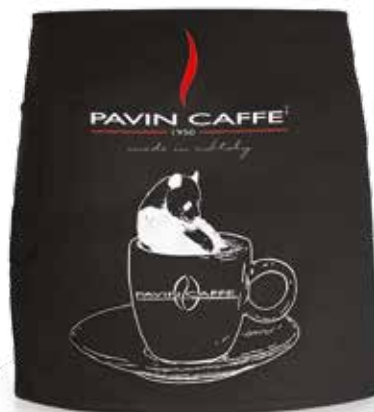
PR082 Traversa corta Panda. Panda short Apron.