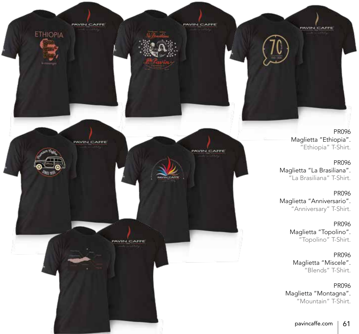
PR096 Maglietta "Ethiopia". "Ethiopia" T-Shirt.