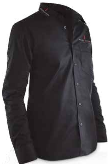
PR094 Camicia. Shirt.