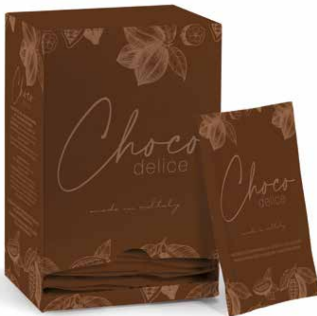
PM020 Cioccolata Choco Delice confezioni da 30 monodosi da 25 gr. Choco Delice in box of 30 monodoses of 25 gr.